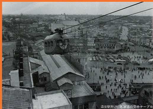
渋谷駅付近、百貨店の空中ケーブル