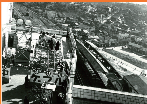
タイトル：東急百貨店屋上の空中ケーブルゴンドラ