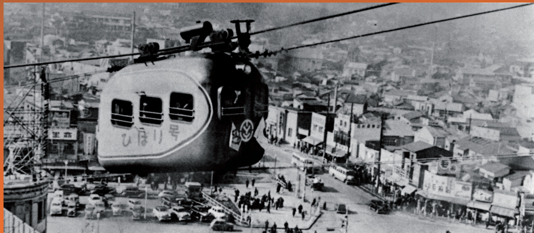
タイトル：昭和27年 東横屋上からのハチ公前広場