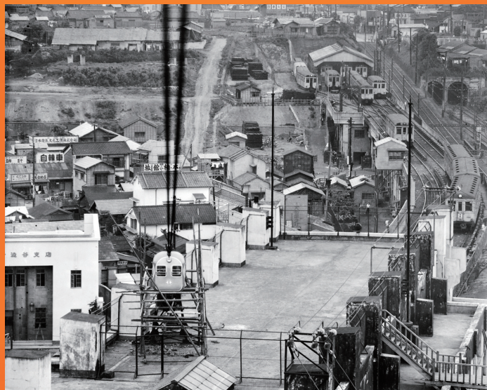
タイトル：1951年 渋谷のロープウェイ「ひばり号」

ひばり号は僅か1年半程で撤去されてしまったため 現存する写真は数少なく、とても貴重な写真です。 ひばり号 フォト・アルバム