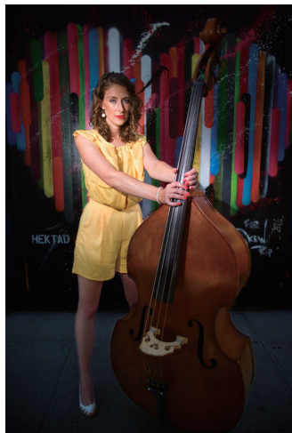
Artwork by @Hektad courtesy of #underhillwalksbk

Congratulation's for "2017 vol. 50"!! All the best masayuki!!